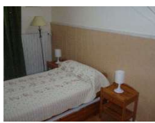
1 lit gignone (2 lits simples ou 1 double)